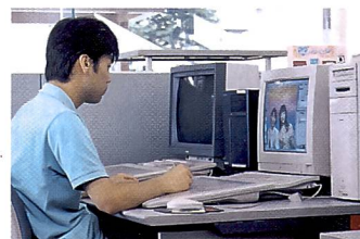
Professionelle Gestalter erfüllen jeden Kundenwunsch.