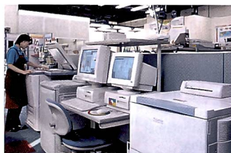
Geräte für jede Art der Bildbearbeitung und Bildausgabe.