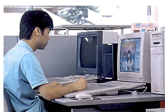
Professionelle Gestalter erfüllen jeden Kundenwunsch.