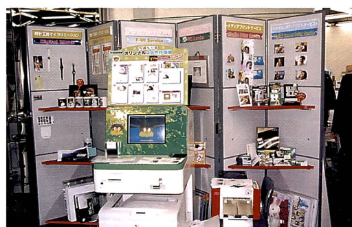
Für schnelle Visiten- und Glückwunschkarten gibt es eine menügeführte Selbstbedienungsstation.