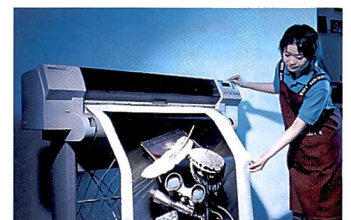
Dem Ausgabeformat sind kaum Grenzen gesetzt.

Team übernimmt alle Arten von Gestaltungsaufträgen für Prospekte, CD-ROMs oder Internetseiten, eine Spezialabteilung macht Aufzieh- und Laminierarbeiten, und wer sich gerne selbst an den Computer setzt, dem stehen spezielle Kundenarbeitsplätze mit oder ohne fachlicher Anleitung zur Verfügung.