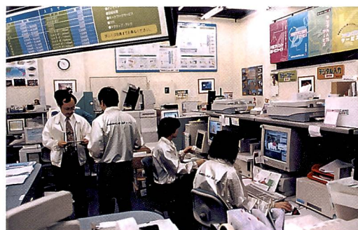
Auf engem Raum betreiben 27 Angestellte jede Art von Bildgestaltung für ausgefallene Produkte.