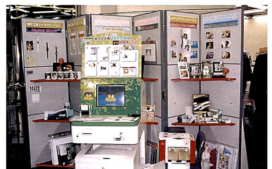
Für schnelle Visiten- und Glückwunschkarten gibt es eine menügeführte Selbstbedienungsstation.