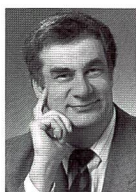
Urs Tillmanns Fotograf, Fach- publizist und Herausgeber von FOTOintern

Und ob Schwarzweiss ein Thema ist! Dass wir in der letzten Ausgabe eine Marktübersicht über Schwarzweissfilme und in diesem Heft eine Auflistung aller Schwarzweisspapiere des Weltmarktes bringen, ist kein Zufall. Es hat in letzter Zeit eine Menge neuer Schwarzweissprodukte gegeben, die eine wesentlich verbesserte Qualität auf die Papiere bringen – auch auf solche mit PE-Träger.