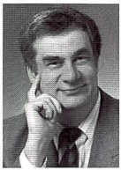
Urs Tillmanns Fotograf, Fach- publizist und Herausgeber von FOTOintern

Und ob Schwarzweiss ein Thema ist! Dass wir in der letzten Ausgabe eine Marktübersicht über Schwarzweissfilme und in diesem Heft eine Auflistung aller Schwarzweisspapiere des Weltmarktes bringen, ist kein Zufall. Es hat in letzter Zeit eine Menge neuer Schwarzweissprodukte gegeben, die eine wesentlich verbesserte Qualität auf die Papiere bringen – auch auf solche mit PE-Träger.