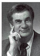
Urs Tillmanns Fotograf, Fach- publizist und Herausgeber von FOTOintern

Danke – Sie waren super! Die Leserinnen und Leser von FOTOintern haben sich echt Mühe gegeben beim Ausfüllen unseres Fragebogens in der Ausgabe 13/98. Dabei haben wir es Ihnen nicht leicht gemacht. Wir wollten Ihr Leseverhalten kennenlernen, wir wollten wissen, was Ihnen an FOTOintern gefällt und was nicht. Wir wollten wissen, was Sie – ausser FOTOintern – noch lesen und wie häufig, und schliesslich wollten wir auch noch vieles über Ihre Person wissen. Diese Informationen sind für uns ausserordentlich wertvoll, weil wir mit der Auswertung dieser Daten ein noch besseres Heft für Sie machen können. Die ganze Mühe wurde auch belohnt. 50 attraktive Preise gab es zu gewinnen, und wer zu den glücklichen Gewinnerinnen und Gewinnern gehört, steht auf Seite 21 dieser Ausgabe. Ein ganz herzliches Dankeschön all jenen, die den Fragebogen mit persönlichen Kommentaren versehen haben. Lob und Kritik – beides ist gleichermassen wichtig. Ich werde mir die Zeit nehmen, alle Bemerkungen und Anregungen zu lesen und bestmöglich zu berücksichtigen.