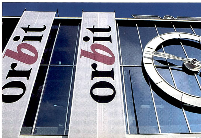
Die Orbit, jährliche Leistungsschau der IT-Branche, zog auch in diesem Jahr grosse Publikumsströme nach Basel.