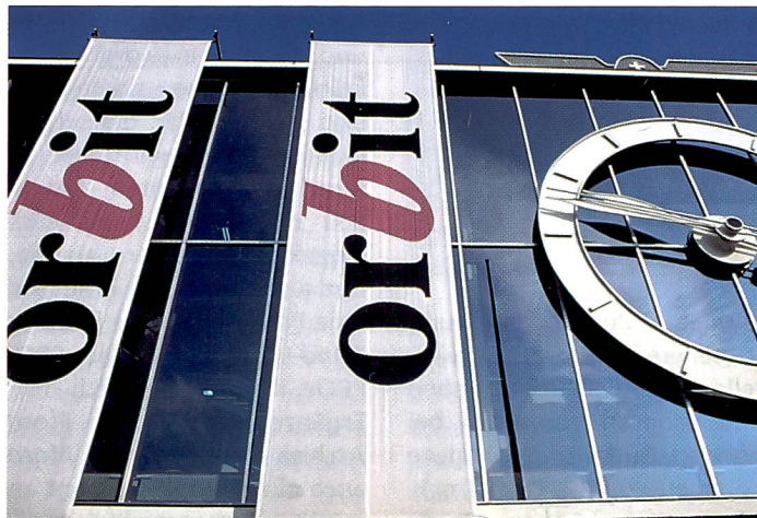
Die Orbit, jährliche Leistungsschau der IT-Branche, zog auch in diesem Jahr grosse Publikumsströme nach Basel.

Microsoft zeigte Office 2000 – nun wirklich bald wie ein Browser aufgebaut – und eine Vorabversion von NT 5.0 – das wohl die Windows-Schienen vereinen wird, so dass nicht mehr mit einem Win 99 oder Win 2000 gerechnet werden darf. Auch interessant: Nach jahrelanger Weigerung des Softwareriesens, im Grafikmarkt mitzuziehen, kam zur Orbit erstmals ein Gates-Programm für diesen Sektor: Mit PhotoDraw 2000 sollen Bildbearbeitung und Grafikdesign gleichermaßen möglich sein. Und das auch in Verbindung