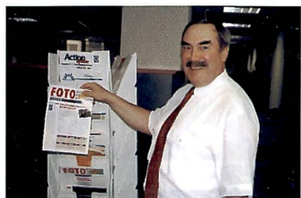
Alle zwei Wochen kommt Post aus der Schweiz: FOTOfachhandel

Lehmann: Die Länderniederlassungen werden sich künftig vermehrt auf nationale Aufgaben wie Marketing, Kommunikation und Verkaufsförderung konzentrieren. Da sind Bereiche, die sich kaum zentralisiert