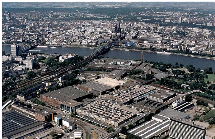
Das gigantische Messegelände liegt mitten in der Stadt Köln und ist mit den für photokina-Besucher kostenlos benutzbaren öffentlichen Verkehrsmitteln sehr gut erreichbar.

Dieser Entwicklung trägt auch die neue Hallenbelegung der photokina Rechnung. Die vier kompakten Schwerpunktzentren werden durchgängig für jeden Besucher geöffnet sein: Im Sektor Consumer Foto, Video, Imaging in den Hallen 1 bis 4 und 5 bis 8 präsentieren die internationalen Unternehmen der Fotoindustrie ihr consumerorientiertes Angebot an Kameras, Filmen, Foto- und