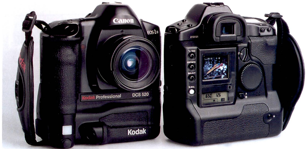
Die neue Kodak Professional DCS 520 basiert auf der bewährten Canon EOS 1N. Ohne zeitraubendes Umgewöhnen der Arbeitstechnik ist sie auf die Bedürfnisse der Berufsfotografen zugeschnitten.

Die Kodak DCS 520 ist mit einem 2-Megapixel Sensor ausgestattet und verfügt über eine Serienbildfunktion, die bis zu maximal 3,5 Bilder pro Sekunde ermöglicht. Durch die variable Empfindlichkeit des Sensors von ISO 200/24° bis 1600/33° erfüllt die Kamera ihren Zweck selbst bei schlechten Lichtverhältnissen. Das Farbdisplay auf der Rückseite der Kamera ermöglicht die sofortige Kontrolle der Aufnahme. Eine spezielle Anzeige macht hier direkt auf unter- oder überbelichtete Aufnahmen aufmerksam. Auf dem Display lassen sich wahl-