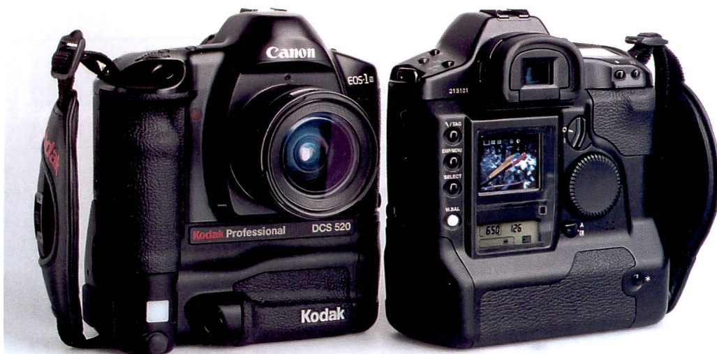
Die neue Kodak Professional DCS 520 basiert auf der bewährten Canon EOS 1N. Ohne zeitraubendes Umgewöhnen der Arbeitstechnik ist sie auf die Bedürfnisse der Berufsfotografen zugeschnitten.

Die Kodak DCS 520 ist mit einem 2-Megapixel Sensor ausgestattet und verfügt über eine Serienbildfunktion, die bis zu maximal 3,5 Bilder pro Sekunde ermöglicht. Durch die variable Empfindlichkeit des Sensors von ISO 200/24° bis 1600/33° erfüllt die Kamera ihren Zweck selbst bei schlechten Lichtverhältnissen. Das Farbdisplay auf der Rückseite der Kamera ermöglicht die sofortige Kontrolle der Aufnahme. Eine spezielle Anzeige macht hier direkt auf unter- oder überbelichtete Aufnahmen aufmerksam. Auf dem Display lassen sich wahl-