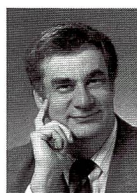
Urs Tillmanns Fotograf, Fach- publizist und Herausgeber von FOTOintern