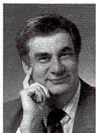
Urs Tillmanns Fotograf, Fach- publizist und Herausgeber von FOTOintern