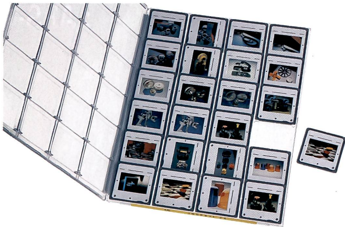
Die Dia-Sichtkassette «Journal 24» schützt die Dias vor Staub und Zerkratzen und bietet einen totalen Überblick bei der Archivierung.

Seither hat sich die Sichtkassette millionenfach bewährt, nicht nur der sicheren und platzsparenden Archivierung wegen, sondern auch, weil das Zusammenstellen eines Vortrages oder die Präsentation einer grösseren Anzahl