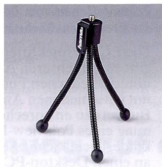
Ein Ministativ findet in jeder Fototasche Platz. (Hama)

An sich lohnt der Einsatz eines Stativs in nahezu allen Aufnahmesituationen, sieht man einmal von den spontanen