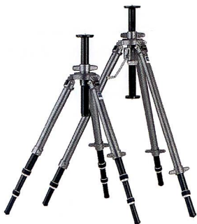
Dreibeinstative gibt es in verschiedensten Grössen. (Gitzo)

Die Grundauführungen sind das Einbein- und das Dreibeinstativ – vom Taschenmo-