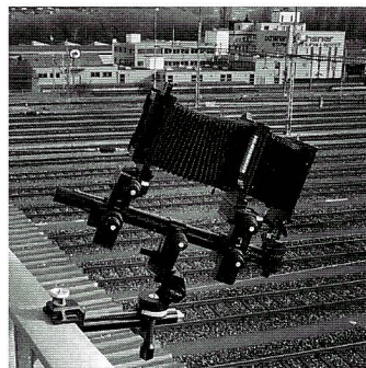
Klemmstative erweisen sich als äusserst praktisch. (Foba)

Extreme Aufnahmesituationen, wie zum Beispiel das formatfüllende Fotografieren von Kleintieren und Pflanzen am Boden, erfordern Stative mit umsteckbarer Mittelsäule. Verbindungsstreben zwischen den drei Stativbeinen verhin-