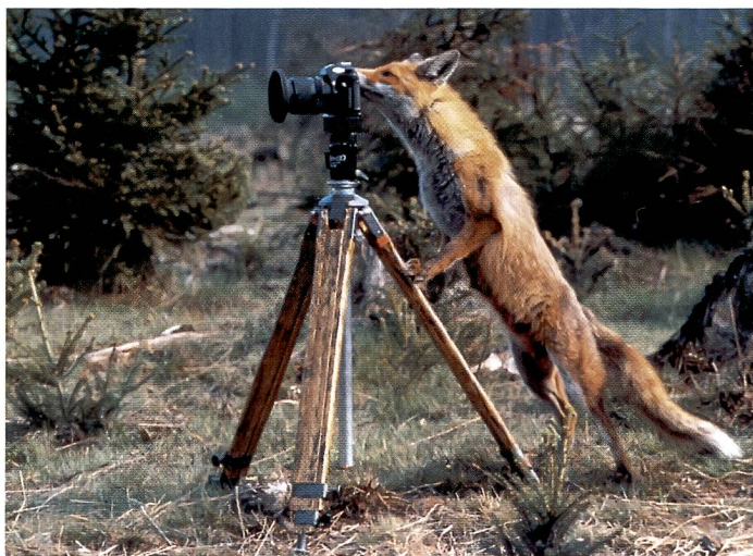
«Schlaue Füchse» benutzen wenn immer möglich ein Stativ, damit die Aufnahmen schärfer werden. (Preisgekröntes Foto von Günter Schuhmann, Berlebach)

Für die Telebrennweiten bei Zoomobjektiven, die in etwa den Bereich von 100 bis 400 mm abdecken, gilt das gleiche. Oft wird beim Zoomen vergessen, dass man sich im extremen Telebereich befin-