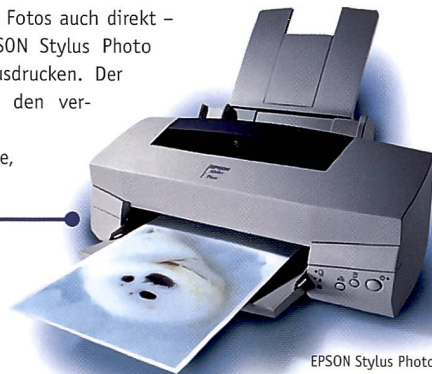
EPSON Stylus Photo