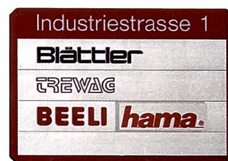
Auch hier wird demnächst ein Firmenschild ausgewechselt...

früher in HiFi investiert hat, braucht jetzt zuerst einmal ein neues Handy. Dabei ist der Freizeitfranken nicht kleiner, sondern grösser geworden. Und in allen diesen Bereichen hat Hama dem Handel ein interessantes Sortiment anzubieten.