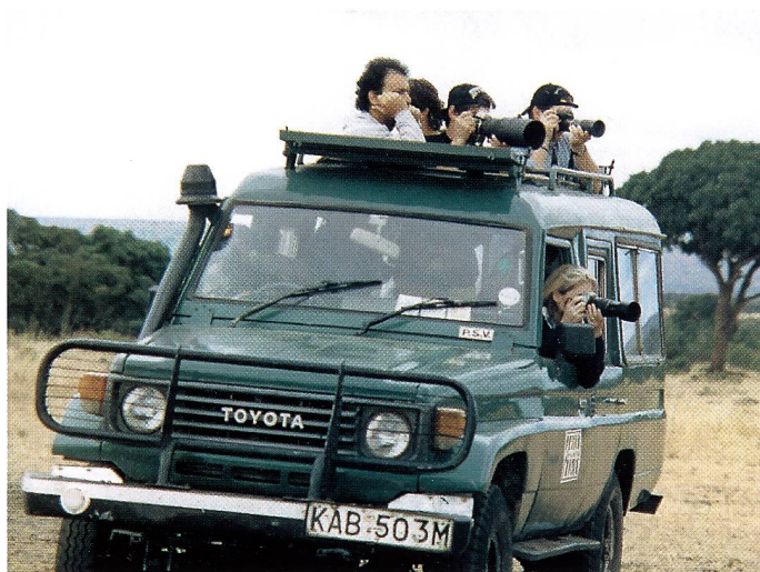
Kenia – eine Welt voller Motive! Was man sonst nur aus Büchern kennt, lief nun – in sicherer Distanz – frei vor der Linse herum

Auf die Analyse der verschiedenen Konsumentenverhalten folgte die Faszination der sehr reichen Fauna und Flora