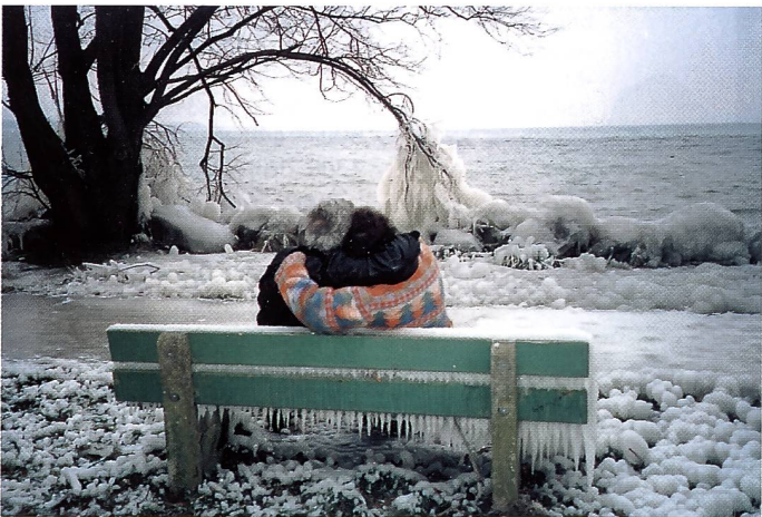
Siegerbild September: Claudine Deriaz, 1416 Pailly