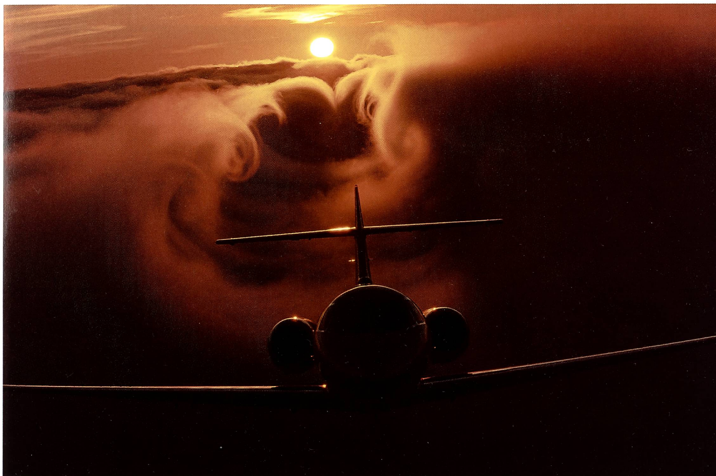
Canon EF 75-300mm f/4-5.6 IS USM, 1/125, f/11