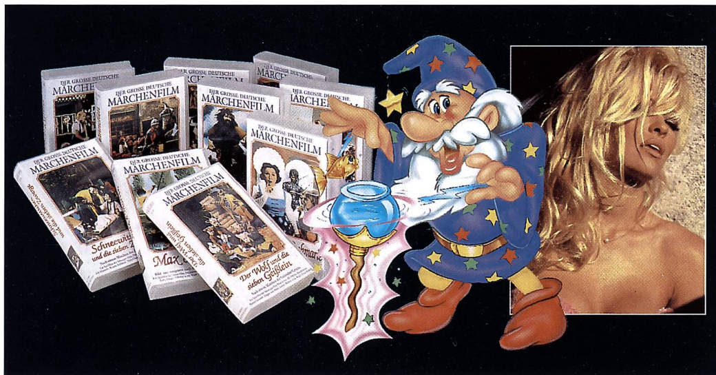
ROWI bietet neu Videofilme aus der Welt der Märchen, des Trickfilms und der Erotik an. Mit einem speziellen Verkaufsdisplay sind die Videofilme als preisgünstige und attraktive Mitnahmeprodukte ein gutes Zusatzgeschäft.

Die Besucher der Orbit haben es uns bestätigt: Leute, die sich für Fotografie interessieren, haben auch andere Inte-