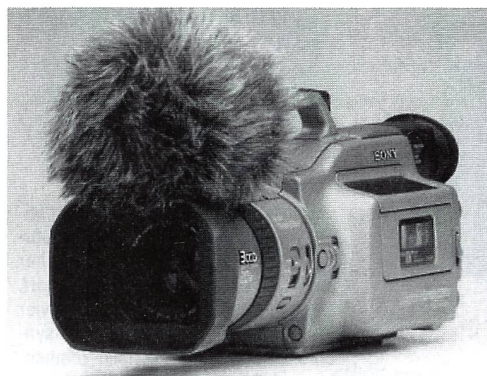
«Kamera mit Perücke»? Der Rycote Windschutz reduziert Windgeräusche auf ein natürliches Mass.

ressen, die mit dem Bild zusammenhängen.