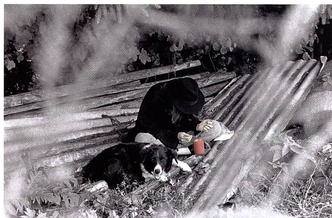
«Hände weg! – Drogen» von Susanne Nüesch

Zum zweiten Mal wurde dieses Jahr unter den Mitgliedern der Interphot' ein Porträtwettbewerb für Lehrlinge ausgeschrieben. Zum Thema «In & Out» mussten zwei Bilder eingereicht werden. Wie das Thema interpretiert wurde, war der eigenen Fantasie überlassen. Ziel der Porträtwettbewerbe von Interphot' ist es, die Lehrlinge anzuregen, sich mit einem vorgegebenen Thema zu befassen und dieses fotografisch umzusetzen. Dass dabei auch noch attraktive Preise zu gewinnen sind, ist natürlich ein willkommener Nebeneffekt. Aber, gute Leistungen sollen auch belohnt werden. Erstaunlich ist, dass auch diesmal der Wettbewerb wiederum von weiblichen Lehrlingen gewonnen wurde. Sind es