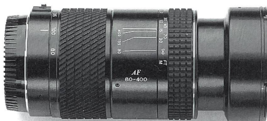
Tokina AT-X AF 4,5-5,6/80-400 mm

Ob Sie mit Canon, Minolta, Nikon oder Pentax AF fotografieren, mit dem ersten 80-400-mm-Zoom der Welt kommen Sie schneller näher ran. In einem strapazierfähigen Metallgehäuse von nur 13,6 Zentimeter Baulänge bietet dieses Fünffachzoom eine profitaugliche Hochleistungsoptik zu einem auch für Amateure attraktiven Preis: Fr. 1380.–.