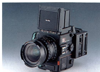
Professionelle Mittelformatkameras bleiben das Kerngeschäft

des Unternehmens vorgibt und es hervorragend versteht, seine Mitarbeiter zu motivieren. Man ist zu Recht stolz auf das «Made in Germany» und die soeben erworbene Zertifizierung ISO 9001.