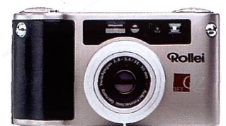
Ausrichtung auf eine neue Zielgruppe mit den QZ-35-Modellen

le Kunden in jeder Hinsicht äusserst attraktiv ist. Kerngeschäft von Rolleil – und weiterhin ein breites Entwicklungsfeld neuer Produkte – stellt der Bereich der Mittelformatkameras dar, wo sich Rolleil unüberhörbar vorgenommen hat, seine Marktführerrolle weiter auszubauen. Damit deckt Rolleil nicht nur einen grossen Bedarf im pro-