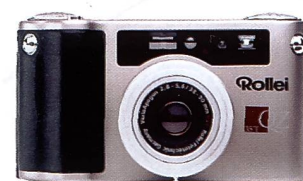
Ausrichtung auf eine neue Zielgruppe mit den QZ-35-Modellen

le Kunden in jeder Hinsicht äusserst attraktiv ist. Kerngeschäft von Rolleil – und weiterhin ein breites Entwicklungsfeld neuer Produkte – stellt der Bereich der Mittelformatkameras dar, wo sich Rolleil unüberhörbar vorgenommen hat, seine Marktführerrolle weiter auszubauen. Damit deckt Rolleil nicht nur einen grossen Bedarf im pro-