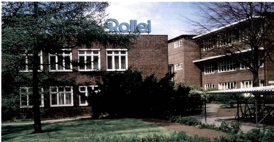
Im Hauptsitz von Rolleil in Braunschweig ist seit einem Jahr das Rolleil/Samsung F+E-Zentrum untergebracht