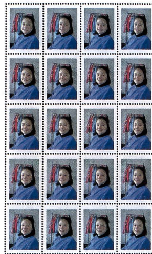
Der Standard-Briefmarkenbogen ab jeder Vorlage mit 40 persönlichen Postgrüssen kostet im Fotofachgeschäft nur 30 Franken