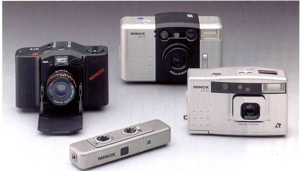
Die neue Minox-Linie: Neben den bisherigen Spezialitäten, der Klapp- und der Miniaturkamera, präsentiert Minox nun auch eine Zoomkompakt- und eine APS-Kamera. Sie lassen das neue, einheitliche Erscheinungsbild künftiger Minox-Produkte erkennen.

Die beiden wichtigsten Kameramodelle im Kleinbildbereich sind die Minox CD 70 mit einem Zweifachzoom 35-70 mm und die APS-Taschenkamera CD 25.