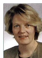
Brigitta Erhardt, Foto Video Ganz AG, Zürich

«Drei Tage Rummel», unter dieses Motto könnten wir die Demonstration von digitalen Kameras stellen. Zehn EDV-Anlagen und über 15 verschiedene Kameras mit Druckeinheiten und Scannern wurden von Donnerstag bis Samstag