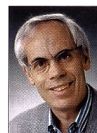
Hansjörg Stöckli, Ecker Foto Studio AG, Luzern

Das Echo war überwältigend: Über 100 Interessierte besuchten die Vorführung, obwohl sie an einem Sonntag