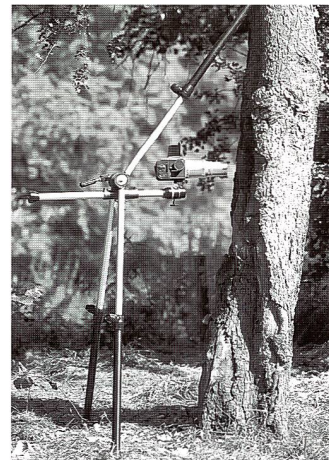
... an einem Baum, bestückt mit einer schweren 6x6-Kamera ...