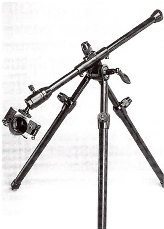
Benbo-Stativ zeichnen sich durch höchste Beweglichkeit aus.

Schade ist, dass die Bedienungsanleitung nur in englisch existiert, was dem Benbo-Einsteiger die ersten Schritte mit diesem erklärungsbedürftigen Produkt nicht gerade einfach macht. Es sind nämlich in der Anleitung wesentliche Informationen zum Gebrauch enthalten.