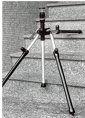
Es kann beispielsweise auf einer Treppe ...