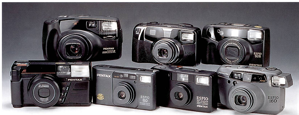
Die wichtigsten Meilensteine von Pentax Zoomkompaktkameras: (v.l.n.r.) Zoom-70 (1986), Zoom 105-Super (1990), Espio 80 (1994), Espio 115 (1993), Espio (1992), Espio 928 (1994) und Espio 160 (1996).

Vor zehn Jahren sorgte die erste Zoomkompaktkamera für Schlagzeilen. Seit-her hat Pentax zehn Millionen Stück dieser Kameraart produziert. Grund genug, die wichtigsten Modelle und technologischen Höhepunkte zu beleuchten.