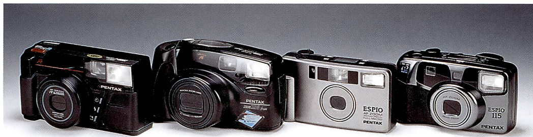
Die wichtigsten Grundformen der Pentax Zoomkompaktkameras: (v.l.n.r.) Zoom-70 (1986), Zoom 105-Super (1990), Espio (1992), Espio 115 (1993).

gründliche Überarbeitung des Designs, Neukonstruktion wichtiger Komponenten, Verwendung neuer Batterien und Einsatz von Mikroprozessoren. Mit der Espio, von der etwa eine Million verkauft wurde, hatte Pentax eins seiner ersten Ziele endlich erreicht: eine Kamera, in der Grösse vergleichbar mit einer Kompaktkamera mit fester Brennweite. Ein halbes Jahr später kam ein neues «Millionending», die Espio 115. Sie war etwa 35 Prozent kleiner und leichter als die Kameras der zweiten Generation mit Dreifach-Zoom und bot noch bessere Ausstattungsmerkmale wie z.B. die Sechsfeldmessung. Als einer der Bestseller in der Pentax Zoomkompaktkameras-Geschichte ist sie noch heute auf dem Markt. Danach folgten weitere Espio-Modelle. Drei von ihnen verdienen besondere Beachtung, kennzeichnen sie doch einen weiteren technischen Durchbruch. Im April 1994 erschien