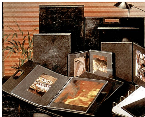
PANODIA-Präsentationsmappen sind praktisch im Gebrauch und ästhetisch im Auftritt.

Die Präsentationsmappen von PANODIA erfüllen einen Mehrfachnutzen, indem sie die Bilder und Dias optimal schützen und zugleich eine ästhetisch saubere Präsentation beim Kunden gewährleisten. Hinzu kommt, dass alle PANODIA