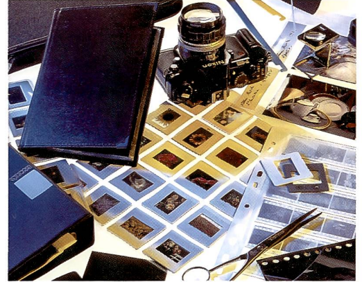
Passepartouts und Diahüllen sind aus archivfestem Material gefertigt und garantieren Haltbarkeit.

mappen gewählt werden. Die Auswahl der Präsentations-Ringbücher umfasst beispielsweise die praktische «Texas»-Reihe in den Formaten 21 x 29,7 cm mit Vier-Ringautomatik sowie 24 x 32, 32 x 44 bis zum Grossformat 41 x 51 cm in Multiringmechanik.