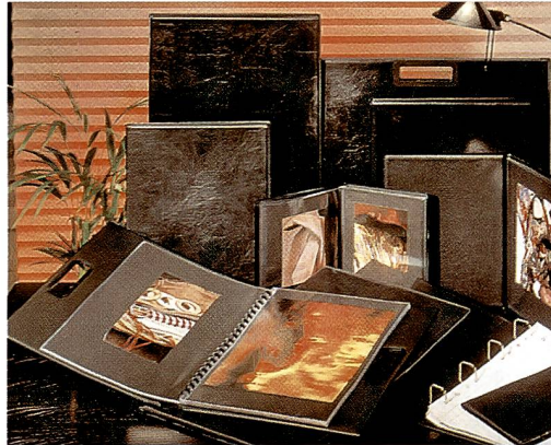
PANODIA-Präsentationsmappen sind praktisch im Gebrauch und ästhetisch im Auftritt.

Die Präsentationsmappen von PANODIA erfüllen einen Mehrfachnutzen, indem sie die Bilder und Dias optimal schützen und zugleich eine ästhetisch saubere Präsentation beim Kunden gewährleisten. Hinzu kommt, dass alle PANODIA