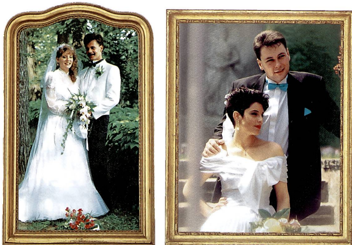
Wie im Film: die Fotos zur Doppelhochzeit.