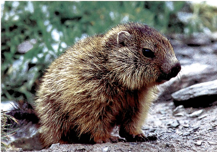
Junges Murmeltier ( Marmota marmota ), ab Mai/Juni auf der Alp.