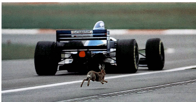
Der Gewinner des Wettbewerbs «Sportfoto des Jahres 1995» Sörli Binder aus Walldorf (D) fotografierte diesen sensationellen Schnappschuss mit einer Canon EOS 1 und einem 400 mm-Objektiv.

Pentax (Schweiz) AG, 8305 Dietlikon, T: 01/833 38 60, F: 01/833 56 54