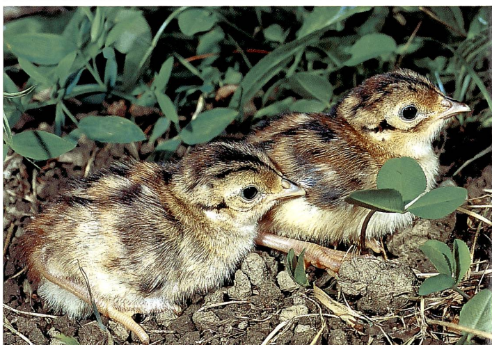
Küken des Fasans ( Phasianus colchicus ), April bis Juni.