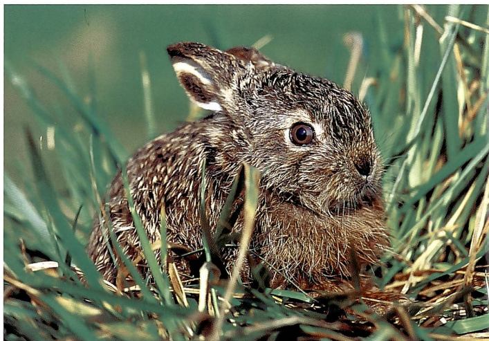
Feldhasen-Nachwuchs ( Lepus europaeus ) gibt's bis zu 4 x im Jahr.