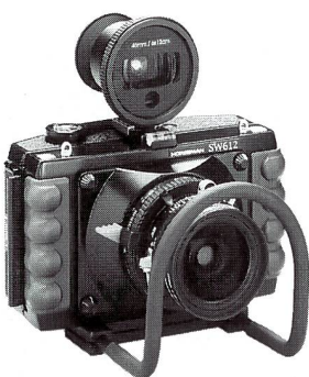
Super Weitwinkel Kamera SW 612