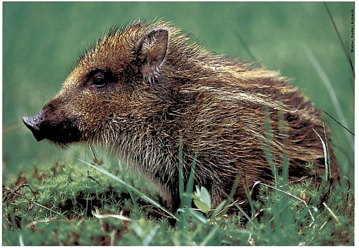
Der Wildschwein-Frischling ( Sus scrofa ) streift im Frühling umher.