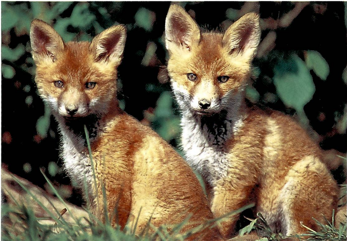
Fuchs-Welpen ( Vulpes vulpes ) lernen im März/April schnüren.