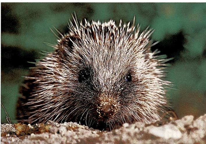
Igel ( Erinaceus europaeus ) sind von Mai bis September jung.