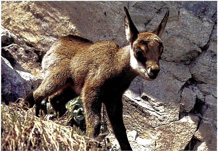
Das Gems-Kitz ( Rupicapra rupicapra ) steht ab Mitte Mai am Berg.