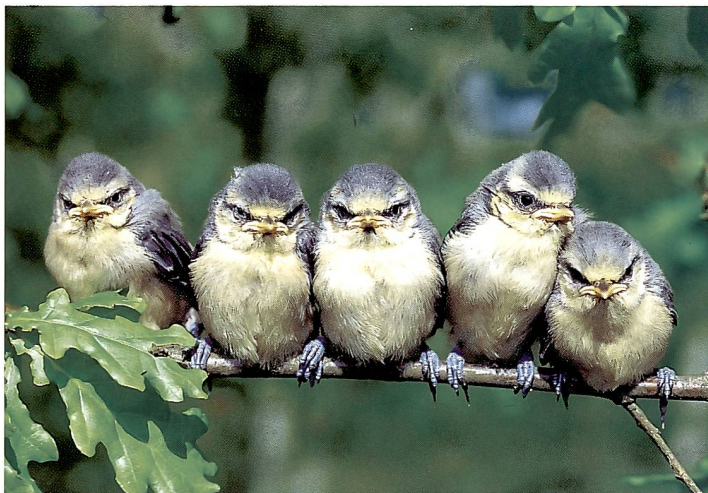
Blaumeisen-Flügglinge ( Parus caeruleus ) flattern im April/Mai los.