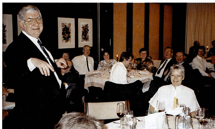
Abends wurde anlässlich des Gala-Diners für ein buntes Unterhaltungsprogramm mit vielen Überraschungen gesorgt.

Das Ausbildungszentrum zef konnte im Berichtsjahr auf eine finanziell solidere Basis gestellt werden. Es sei zu hoffen, dass Zentrumsleiter Schwarzenbach schon bald durch eine administrative Hilfe entlastet würde. Das Ver-