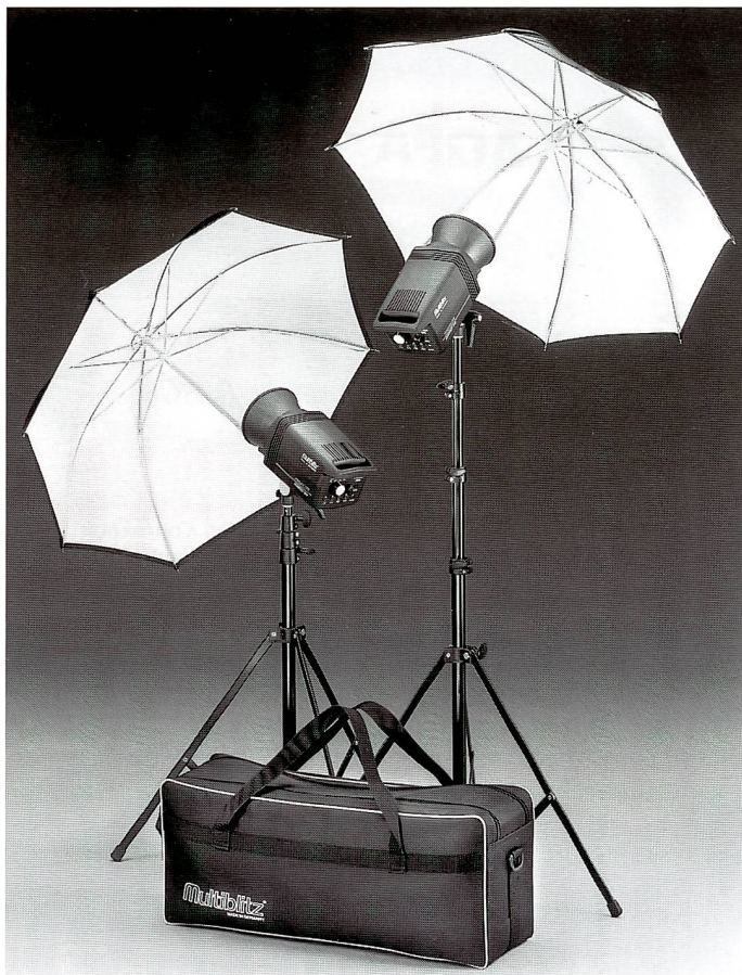
Profilite 200 Compact Set stellt mit zwei Geräten in Komplett-Ausstattung die ideale Lichtausrüstung für den Fotografen unterwegs dar.

das bedeutet Blende 22 mit dem Normalreflektor aus 2 m Abstand bei einer Filmempfindlichkeit von ISO 100. Hinzu kommt die stufenlose Energieregulierung über vier Blendenstufen bei proportionalem, hellem Halogeneinstlicht. Natürlich können die farbneutrale, UV-gesperr-