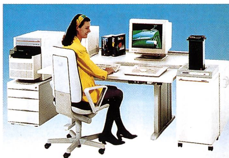
Agfa Inova wurde speziell für Minilab-Betreiber, Fotolabore und Fachgeschäfte entwickelt.