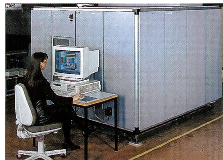
Der Durst-Belichter Lambda 130 belichtet Digitaldaten auf 127 cm breites Fotopapier.

sind vor der Entwicklung ein hochempfindlicher Sensor und speichern danach die Bildinformation mit enorm hoher Qualität. Hinsichtlich der qualitativen und quantitativen Speicherkapazität sind Filme und Fotopapiere von den digitalen «Konkurrenten» nicht zu schlagen. Auch deshalb nicht, weil die auf der Silberhalogenid-technologie basierenden Verfahren für die Produktion mittlerer Auflagen wesentlich kostengünstiger sind.