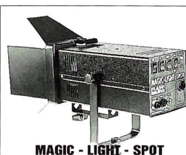
MAGIC - LIGHT - SPOT

Ein Profisystem der Extraklasse Kein anderes System bietet Ihnen Gleiches Bitte fordern Sie Ihren persönlichen Prospekt inklusive Preisliste per Telefon oder Fax an