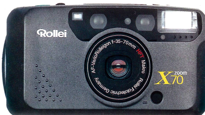
Mit dem neuen Erfolgsmodell Zoom 70X liegt die Marke Rollei in einem attraktiven Preissortiment und bietet viel Automatikkomfort.

und ist mit dem mehrschichtvergüteten Rollei HFT 35-70-mm-Zoom auf kreatives Fotografieren ausgelegt. Das aktive Infrarot-Autofokus-System besitzt 256 Stufen und einen Schärfespeicher. Mit der Makrostellung bis 0,5 cm, der Schnappschuss-Einstellung für den Entfernungsbereich 1,3 bis 5 m und der Unendlich-Position ist die Rollei Zoom X70 technisch gut ausgerüstet. Zudem bietet sie Porträtfunktion mit automatischer Bildausschnitt-Einstellung. Dazu: «Fuzzy-Logic», Blitzautomatik, Vorblitz, Serien- und Intervallaufnahmen sowie Mehrfachbelichtungen. Die gewählten Funktionen werden auf einem übersichtlichen LCD-Display angezeigt.