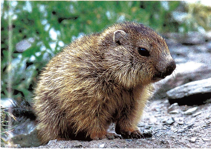
Junges Murmeltier ( Marmota marmota ), ab Mai/Juni auf der Alp.