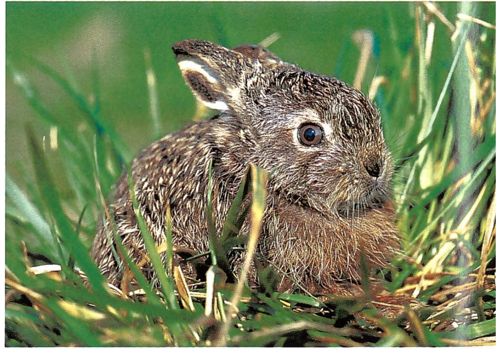
Feldhasen-Nachwuchs ( Lepus europaeus ) gibt's bis zu 4 x im Jahr.