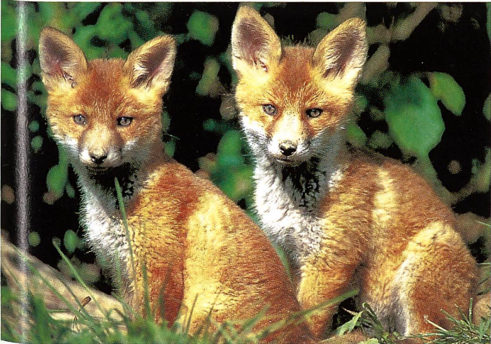
Fuchs-Welpen ( Vulpes vulpes ) lernen im März/April schnüren.