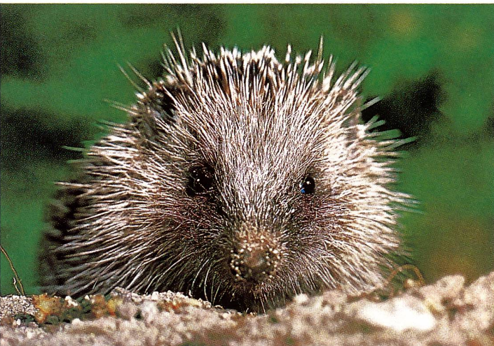
Igel ( Erinaceus europaeus ) sind von Mai bis September jung.