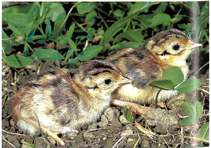
Küken des Fasans ( Phasianus colchicus ), April bis Juni.