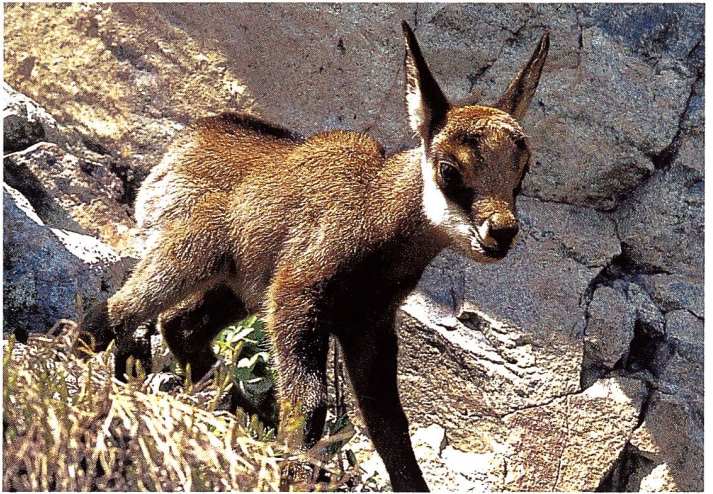
Das Gems-Kitz ( Rupicapra rupicapra ) steht ab Mitte Mai am Berg.