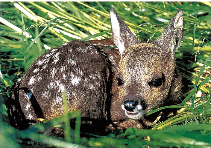
Reh-Kitz ( Capreolus capreolus ) macht erste Kapriolen im Mai/Juni.