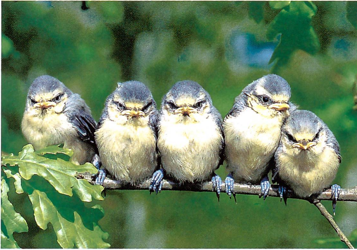
Blaumeisen-Flügglinge ( Parus caeruleus ) flattern im April/Mai los.