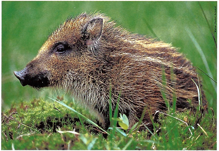
Der Wildschwein-Frischling ( Sus scrofa ) streift im Frühling umher.