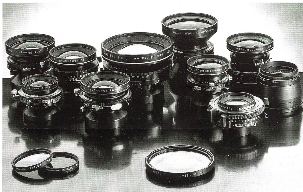
Rodenstock bietet ein komplettes Sortiment für den gesamten Bedarf der grossformatigen Berufsfotografie

Als klassisches Repro-Objektiv der weltberühmte Scharfzeichner – nicht nur für die Reproduktion, sondern mit seinem Bildwinkel von 48° ist es auch ein erstklassiges langbrennweitiges Objektiv.