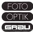
Foto - Video - Optik GRAU 6300 Zug am Bundesplatz Telefon 042/22 23 66

Wir wünschen uns eine fröhliche, aufgestellte Person mit Erfahrung im Fotoverkauf, möglichst auch in Video und Projektion. Sie sind motiviert und freuen sich auf den Kontakt mit einer anspruchsvollen Kundschaft. Sie möchten einen sicheren Arbeitsplatz im schönen, steuergünstigen Städtchen Zug? Wenn ja, dann senden Sie uns Ihre Kurzofferte, wir werden uns sofort mit Ihnen in Verbindung setzen.