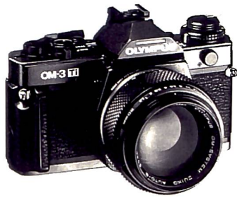
Renaissance: Olympus OM3-Ti

Modellpflege mit einem nostalgischen Touch fanden wir bei Leica und Olympus: Die Leica M6-J erschien zum Jubiläum «80 Jahre Leica» in einer limitierten Auflage von 1640 Exemplaren, und mit der