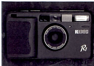
Ultraflach: Ricoh R1

Auf einzelne Modelle werden wir im Neuheitenteil ausführlich eingehen. Im Mittelpunkt der Gespräche standen die wenigen echten Neuheiten, wie etwa die Contax G1 von Yashica-Kyocera, die durchwegs Anerkennung fand. Dass die in allen Belangen gelungene Ricoh R1 eine ernsthafte Anwärtlerin auf die kommenden Jahrespreise sein könnte, bestätigte jeder, der die Kamera in der Hand hielt. Sie verblüfft nicht nur durch ihre extrem dünne Bauweise, sondern auch durch ihre übrigen technischen Eigenschaften.