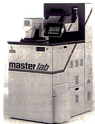
Hybrides Minilab von Gretag

Hybride Systeme sind im Vormarsch, etwa bei Gretag mit dem neuen Minilab Masterlab 740 Digital, das zwar auf Fotopapier arbeitet, jedoch sowohl konventionellen Film als auch digitale Bilddaten verarbeiten kann. Beim Resultatvergleich fällt es selbst Fachleuten schwer, ob mit «gewöhnlichem Licht» oder