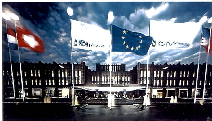
Positiv: Die photokina in Köln konnte dieses Jahr wieder einen stärkeren Besucherstrom verzeichnen als vor zwei Jahren.

Die fotografische Zeitrechnung braucht die photokina, Weltmesse Bild – Ton – Professional Media, als Masseneinheit. Diesmal stand das von Kodak verwendete Motto im Mittelpunkt der riesigen Ausstellung, die vom Besucher beachtliches Durchhaltevermögen und gute Vorbereitung verlangte.