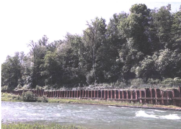
Site pollué de La Pila au bord de la Sarine

Enfin, en octobre 2019, se sont déroulées les élections fédérales. Dans cette optique, et comme d'habitude, nous avons promu l'ecorating de l'Alliance environnementale auprès du public fribourgeois.