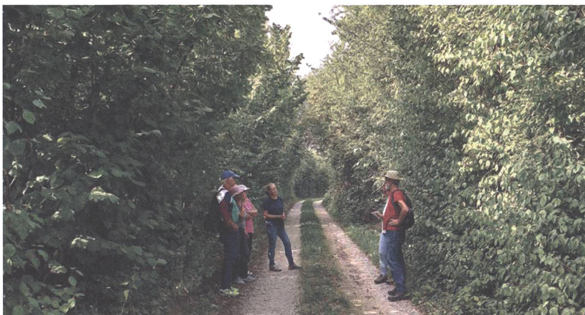
Visite de haies à Kerzers