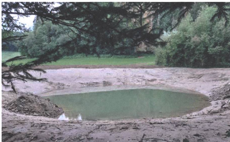
Etangs de Zirkels en cours de finition