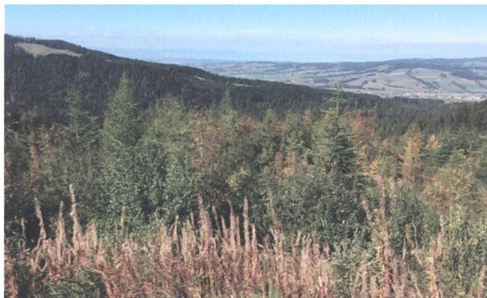
La forêt de la Trême s'étend sur 180 ha et abrite une grande diversité d'espèces

Le support d'information qui doit remplacer la brochure actuelle consacrée à la réserve a pris du retard. Pour rappel, il s'agira d'un dépliant comprenant une carte et un texte de présentation agrémenté de photos. Gratuit, il devrait être disponible en été 2019 et sera le guide idéal pour les visiteurs intéressés par la nature du lieu. Pour ce qui est des travaux prévus, il faut mentionner la rénovation du toit de la cabane des Marrindes (toit en tavillons) et la réfection de certains chemins dans le vallon de Bounavaux.