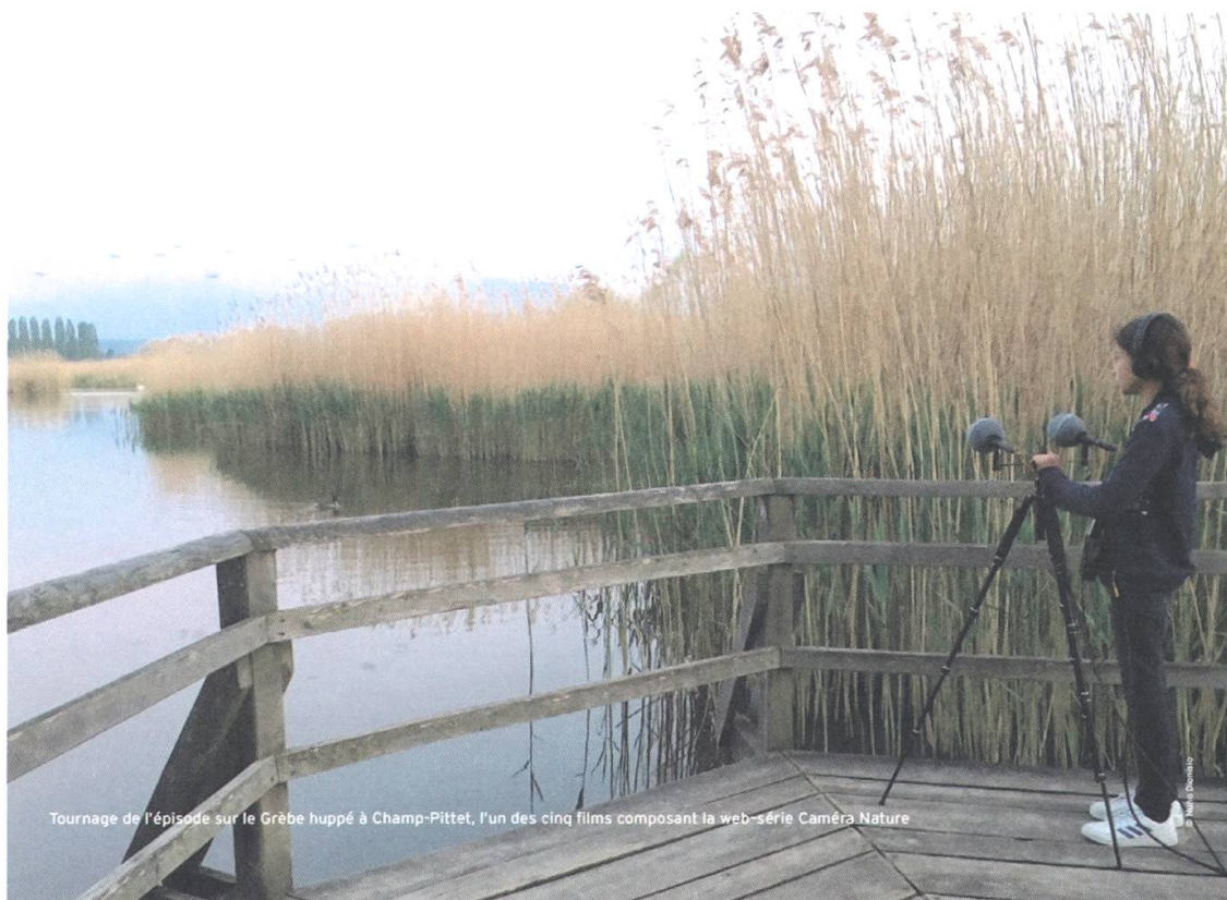
Tournage de l'épisode sur le Grèbe huppé à Champ-Pittet, l'un des cinq films composant la web-série Caméra Nature

Au cours des 59 excursions guidées conduites dans la réserve naturelle de l'Auried, ce sont plus de 600 enfants et adultes qui se sont à nouveau émerveillés devant les Rainettes vertes, petites par la taille mais grandes par la voix, une population de Tritons crêtés en augmentation et de nombreux autres animaux et plantes. A partir de cette année, de nouvelles jumelles seront disponibles pour les excursions.