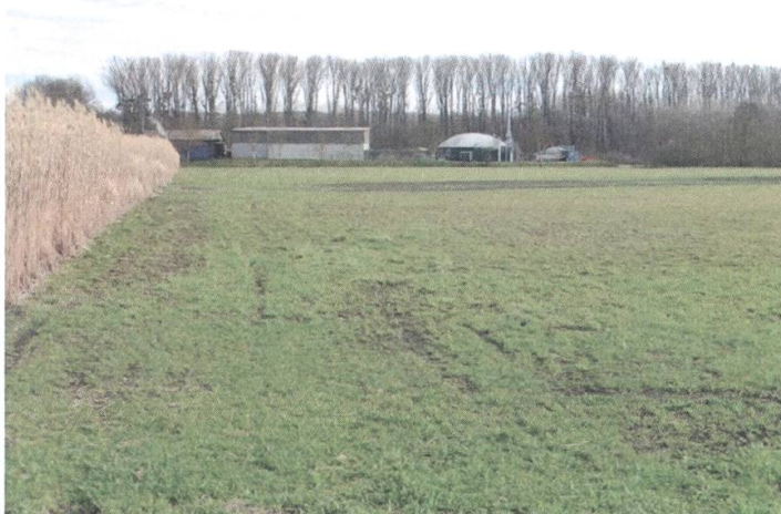
Le site retenu pour le futur centre de biomasse se trouve trop proche d'une forêt alluviale et la construction entravera les déplacements de la faune

A la suite de notre opposition, le Conseil communal a décidé d'abandonner l'éclairage des arbres qui seront plantés dans le quartier du Bourg. Une grande source de pollution lumineuse est ainsi évitée. Les tilleuls de la Place des Ormeaux et les bouleaux de la Cathédrale n'ont par contre pas pu être préservés, en raison des lourds tra-