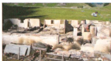
Image de désolation au chalet du Sori