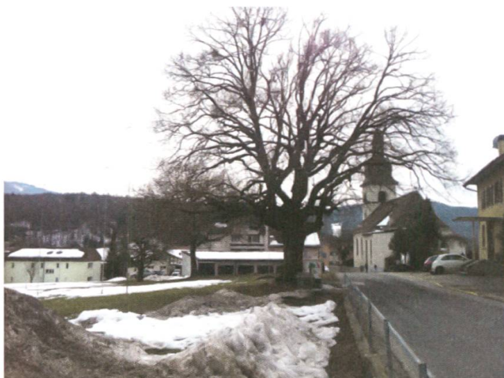
Majestueux tilleul, témoin centenaire

A Bellegarde notamment où nous avons dénoncé des travaux effectués illégalement suite à la rénovation du chalet des Sattels. Cette dernière a été dûment autorisée, mais le permis de construire posait comme