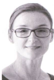
Yolande Peisl Chargée d'affaires