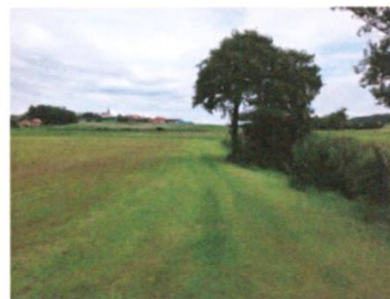
Un épandage conforme aux normes

L'épandage inconsidéré d'engrais peut avoir des conséquences néfastes tant sur la qualité de l'eau que sur la faune et la flore. Cela entraîne progressivement une perte de biodiversité. Cette étude est la seconde du genre menée par une section de Pro Natura, et d'autres sections sont intéressées à conduire des projets similaires à l'avenir. Le rapport final est disponible sur notre site internet.