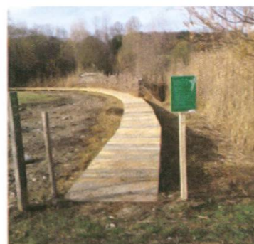
Grâce aux donateurs, la passerelle a fait peau neuve

Comme chaque année, de nombreux élèves sont passés par l'Auried, mais pas seulement. En juin, les membres d'honneur et les grands donateurs de Pro Natura ont découvert ce bijou sous un soleil éclatant. Ils ont pu y voir libellules, grenouilles et oiseaux, dont le vanneau huppé. Deux des trois couples ayant couvé dans la réserve ont été observés ce jour-là. A noter qu'un des jeunes a pu prendre son envol : c'est la seule reproduction réussie en Suisse sans mesures de protection ciblées. La chance aidant, la couleuvre à collier, animal de l'année 2015, a aussi été rencontrée lors de différentes excursions.