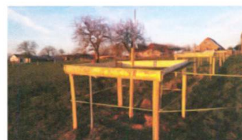
Nouvelle plantation protégée de la pâture à Mannens

Lancé fin 2014, le projet visant à planter 2000 arbres fruitiers haute-tige dans tout le canton se terminera en 2016 avec un résultat mitigé. A fin 2015, le paysage était enrichi de 480 arbres et 147 supplémentaires devaient encore être plantés. Notre objectif ne pourra pas être atteint, car le nouveau programme agricole Qualité Paysage, qui garantit des paiements directs aux agriculteurs contre des prestations en faveur du paysage, soutient financièrement la plantation de fruitiers haute-tige dans tout le canton depuis 2015. Ce programme étant plus avantageux pour les professionnels de la terre, ces derniers n'ont que peu d'intérêt à participer à notre projet. Mais finalement, l'important est que des arbres soient plantés et entretenus.