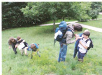
A la recherche des insectes

Nous espérons continuer de développer notre programme d'activités à l'avenir, notamment en proposant des sorties bilingues dès 2016 !