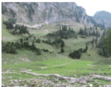
Vue sur les murs de pierres sèches de la Brecca

Le 12 septembre, un petit groupe de bénévoles a contribué à la rénovation des murs en pierres sèches de la vallée de la Brecca. Cette rénovation est l'une des mesures de compensation liées aux travaux d'amélioration des dessertes alpêtres contre lesquels Pro Natura avait fait opposition.