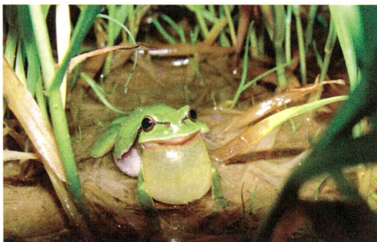
La rainette mâle chante pour attirer sa dulcinée

Nous espérons que vous serez nombreux à nous accompagner à la découverte des rainettes.