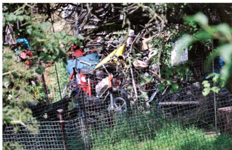
Exemple de décharge sauvage en zone agricole

Le cas des nouvelles turbines installées sans mise à l'enquête par groupe E à la centrale électrique d'Hauterive en 2005, que nous dénoncions en 2010, n'est toujours pas réglé. Un avis de droit produit par Pro Natura, le WWF, la Fédération fribourgeoise des sociétés de pêche et la Frayère confirme que ces travaux nécessitent un permis de construire, voire une nouvelle concession au vu de l'impact sur le cours d'eau et de l'augmentation de la capacité de production électrique. Les différents services de l'Etat sont arrivés à la même conclusion. Groupe E réfute tous les arguments avec la bénédiction du Conseiller d'Etat responsable du dossier. Deux affaires à suivre!