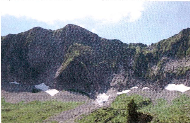
Une majesté qui se passe de commentaires

La rénovation de la façade ouest du pavillon d'information ou encore le nettoyage de deux étangs, pour les libérer de la végétation, entrent dans la première catégorie. L'activité du castor également, qui a décidé de croquer une palissade en