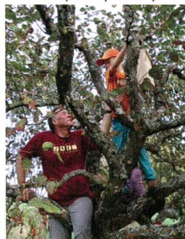
Pose d'un nichoir fabriqué par les enfants

Huit excursions ont été organisées de mars à décembre. Du sauvetage des amphibiens à la construction et la pose de nichoirs à oiseaux, en passant par la «chasse» aux sangliers, la fabrication du fromage d'alpage, la création d'œuvres d'art, l'observation de l'avifaune, les portes ouvertes chez les crapauds, et finalement la fête de Noël, les sujets étaient divers et variés. La fréquentation aussi! Entre 3 et 15 enfants ont participé à six sorties. Deux ont malheureusement dû être annulées par manque d'inscriptions.