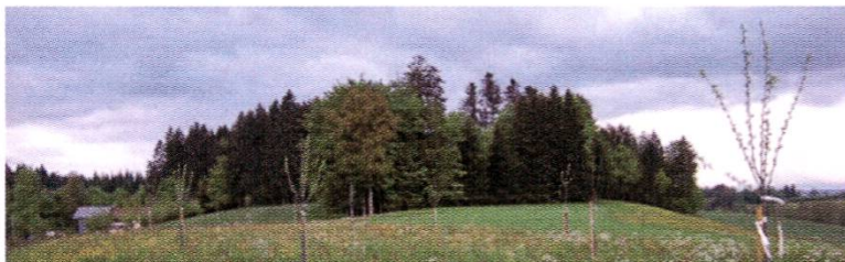
Nouvelle plantation à Saint-Antoine

Quant à la mise en œuvre de cette décision populaire sans équivoque, c'est une autre histoire.