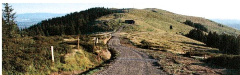
En revenant de la Berra, vue sur Supillette