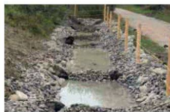
Nursery idéale pour les sonneurs