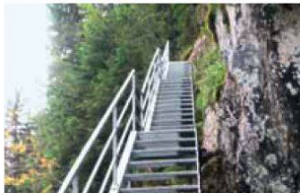
Un sentier pédestre discutable

L'itinéraire "Höhenweg" autour du Lac Noir a été conçu afin d'offrir une alternative supplémentaire aux randonneurs. Intégrant dans la plupart des cas des sentiers déjà existants, ce parcours a nécessité un aménagement ad hoc entre la Brecca et les Recardets, dans une zone difficile d'accès et d'estivage des chamois. Ces travaux ont été mis à l'enquête à posteriori, sur dénonciation de Pro Natura. Cette année, une autorisation spéciale a été délivrée par le canton pour construction hors zone à bâtir, légalisant ainsi l'aménagement. Pro Natura, estimant que les conditions d'une telle autorisation ne sont pas réunies, a recours auprès du Tribunal cantonal.