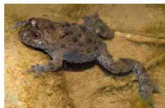
Sonneurs à ventre jaune

rencontrer au pied du barrage de Schiffenen, n'ayant plus été observés dans la réserve depuis quelques années, nous espérons qu'ils recoloniseront les lieux assez rapidement.