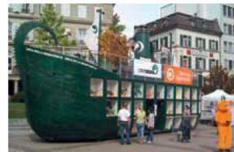
Arche de la biodiversité de Pro Natura

tura a transformé une surface dévolue à la voiture en un jardin citadin. L'Arche de la biodiversité a quant à elle jeté l'ancre sur la Place Python du samedi au jeudi. Petits et grands, familles et classes ont eu ainsi l'occasion de visiter l'exposition dédiée à la perte de la biodiversité et aux causes de cette évolution.