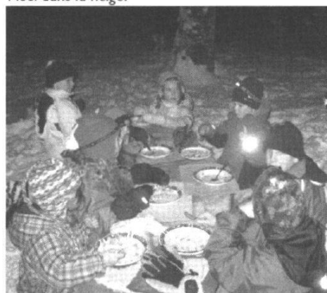
© Catherine Pfister, groupe Jeunes + Nature