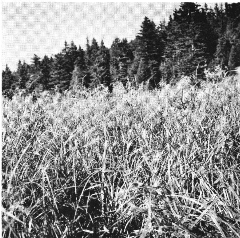
Fig. 2 Cardamino-Scirpetum (Le Niremont)

Scirpus silvaticus se développe avec une telle vigueur qu'il atteint jusqu'à 1 m. 20 de hauteur. Il couvre entièrement le sol, les espèces satellites formant une strate inférieure. Cette caractéristique ne se rencontre jamais dans d'autres groupements avec une telle vitalité. On la rencontre aussi éparses aux bords des ruisseaux, dans les dépressions, mais toujours à l'état stérile.