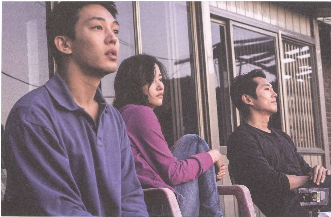
Beoning/Burning 2018, Lee Chang-dong