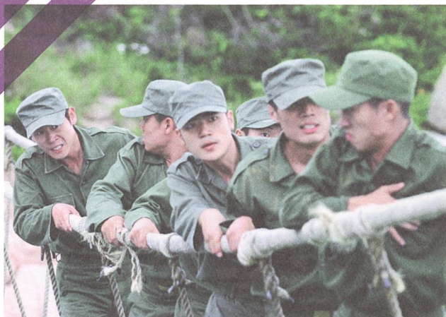
Silmido 2003, Kang Woo-suk

Die Katastrophe scheint die letzte Hoffnung Koreas zu sein: Auch wenn es nicht zur Wiedervereinigung reicht, vielleicht kann man gemeinsam zumindest das Schlimmste verhindern. ■