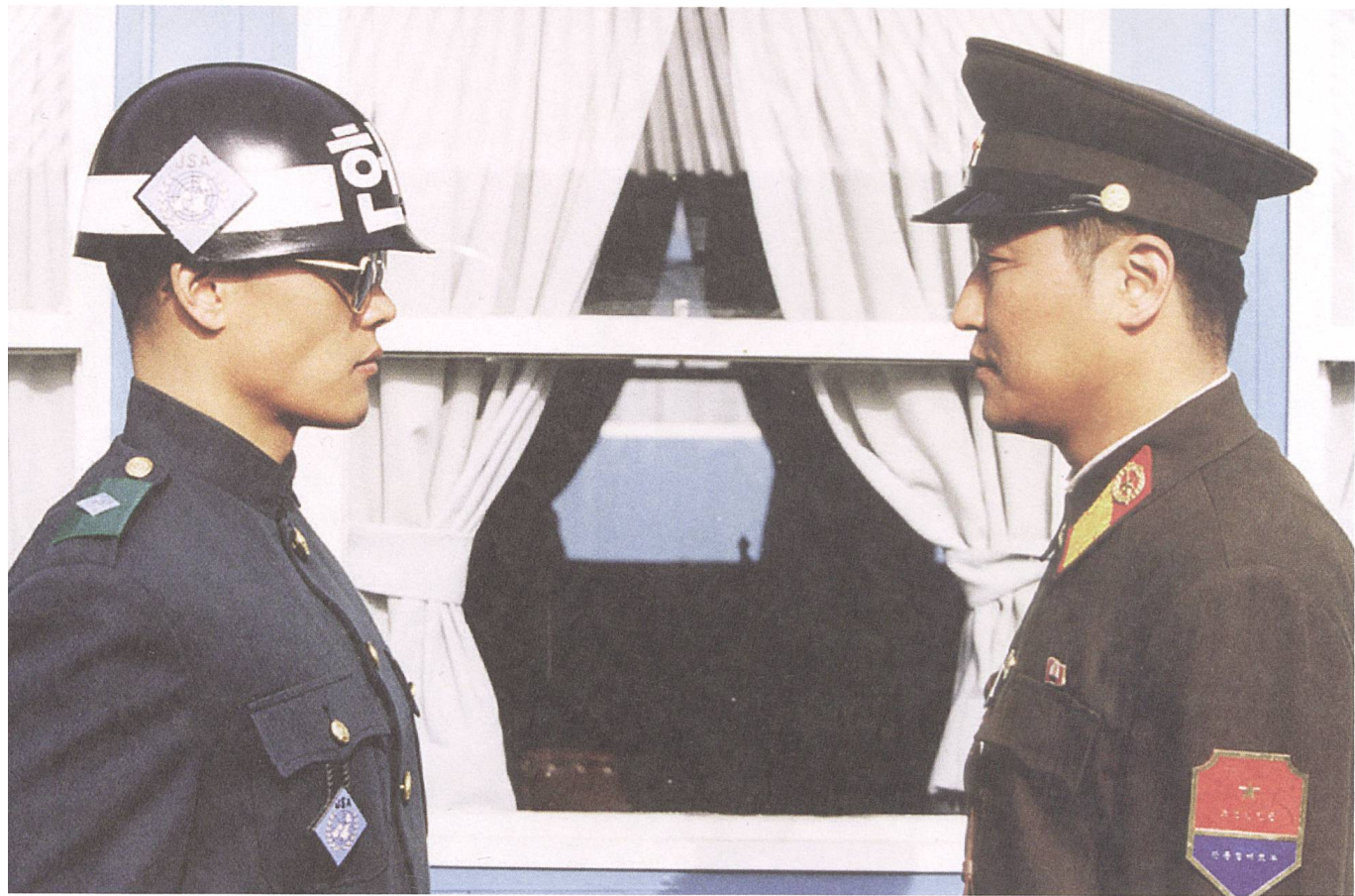
Gongdong gyeongbi guyeok JSA/Joint Security Area 2000, Park Chan-Wook

Wolkenkratzern und Symbolen des hyperkapitalistischen Aufstiegs. Die Terrorist:innen, die dieses Korea verabscheuen, sind nicht allein Feindbild, sondern der hier gänzlich deplatzierte menschliche Gegenentwurf. Shiri ist gleichermaßen Spektakel und Melodrama.