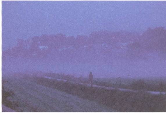
Beoning/Burning 2018, Lee Chang-dong

Sein Leben lang hat der südkoreanische Polizist Song Gi-yeol den nordkoreanischen Guerillaanführer Jagko gejagt. Als er ihn schliesslich fasst, liegt der Krieg in ferner Vergangenheit. Beide Männer sind alt, vom Krebs gezeichnet, dem Tod näher als dem Leben. Aber Song muss seinen Erzfeind verhaften, um seinem sonst verfehlten Leben in den letzten Monaten noch einen Sinn zu geben.