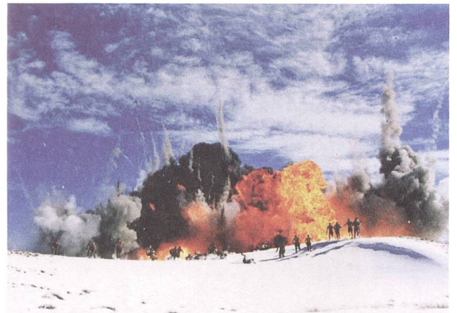
Silmido 2003, Kang Woo-suk

Park Chan-Wooks Gongdong gyeongbi guyeok JSA (Joint Security Area) erschien nur ein Jahr nach Shiri , direkt nach dem historischen Gipfeltreffen zwischen den damaligen Staatsoberhäuptern der beiden Koreas, Kim Jong-il und Kim Dae-jung. Im Fahrwasser des nie wieder erreichten Höchststandes der politischen