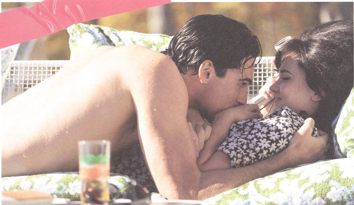
Priscilla 2023, Sofia Coppola

«Als ich davon erfuhr, dass Baz einen Film über Elvis dreht, wusste ich sofort, dass wir uns nicht in die Quere kommen.»