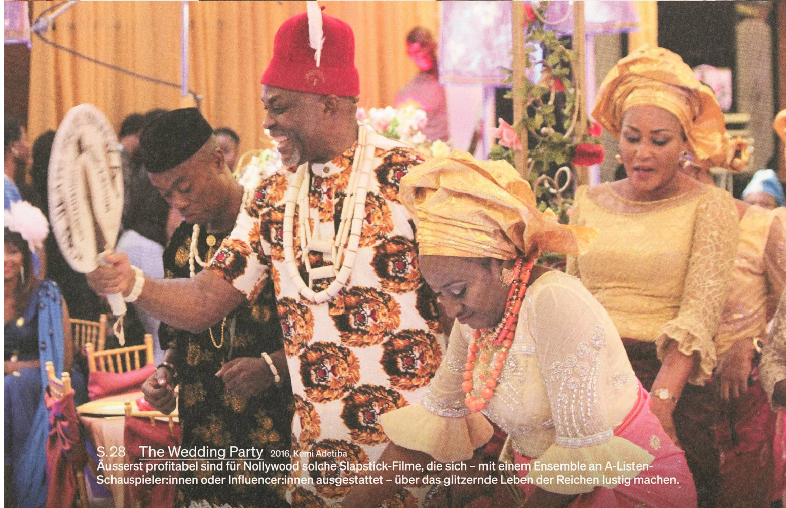
S. 28 The Wedding Party 2016, Kemi Adetiba Äusserst profitabel sind für Nollywood solche Slapstick-Filme, die sich – mit einem Ensemble an A-Listen-Schauspieler:innen oder Influencer:innen ausgestattet – über das glitzernde Leben der Reichen lustig machen.