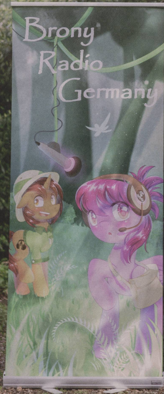
S. 34 Keine Angst vor Pink: «Bronies» nennen sich die Fanclub-Mitglieder der Serie My Little Pony . Mit Radiosendungen, selbstgemachten Plüschtieren und Stammtischen ist die Szene in mehreren deutschen Städten aktiv. Ein Portrait.