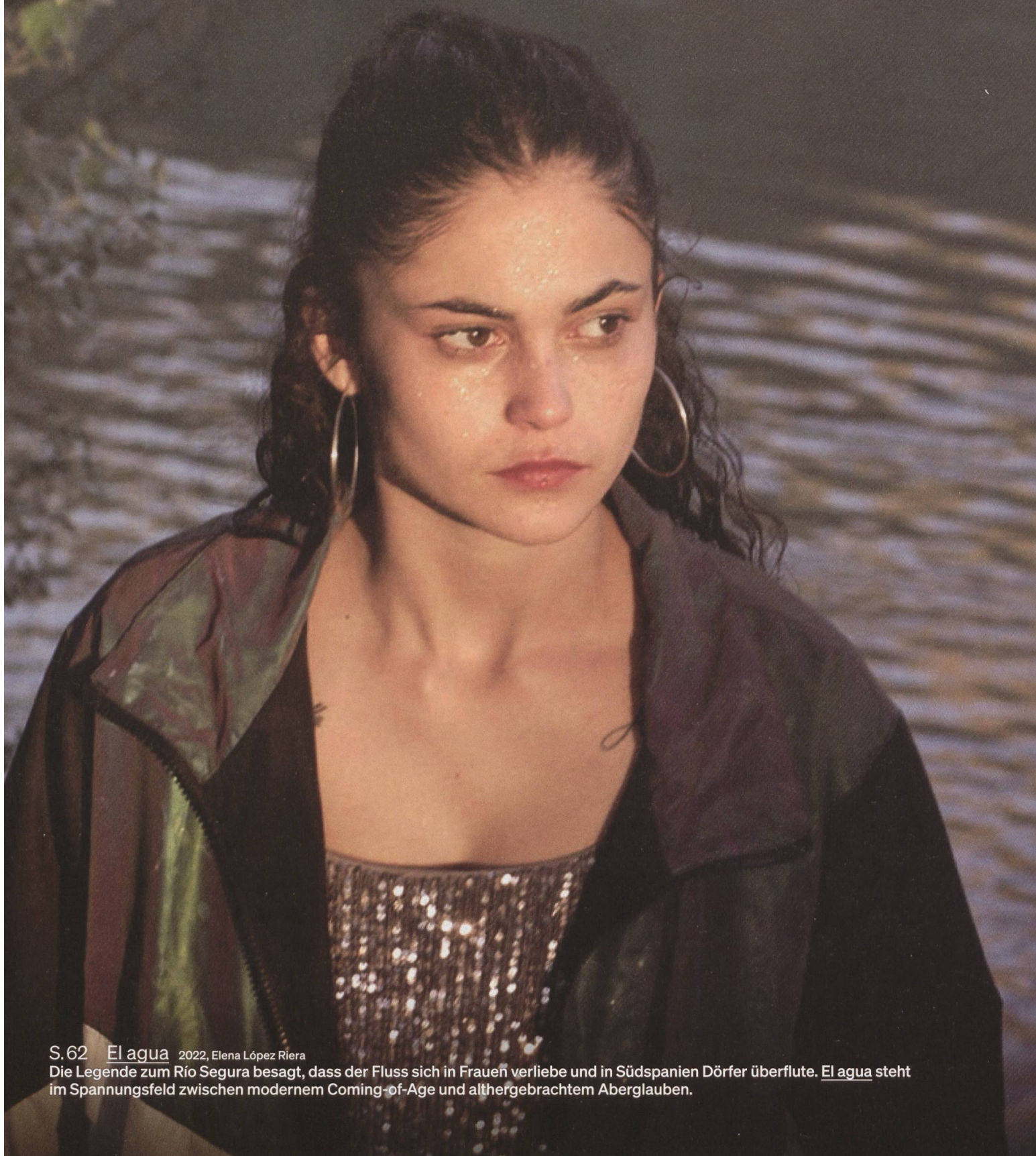
S.62 El agua 2022, Elena López Riera

Die Legende zum Río Segura besagt, dass der Fluss sich in Frauen verliebe und in Südspanien Dörfer überflute. El agua steht im Spannungsfeld zwischen modernem Coming-of-Age und althergebrachtem Aberglauben.