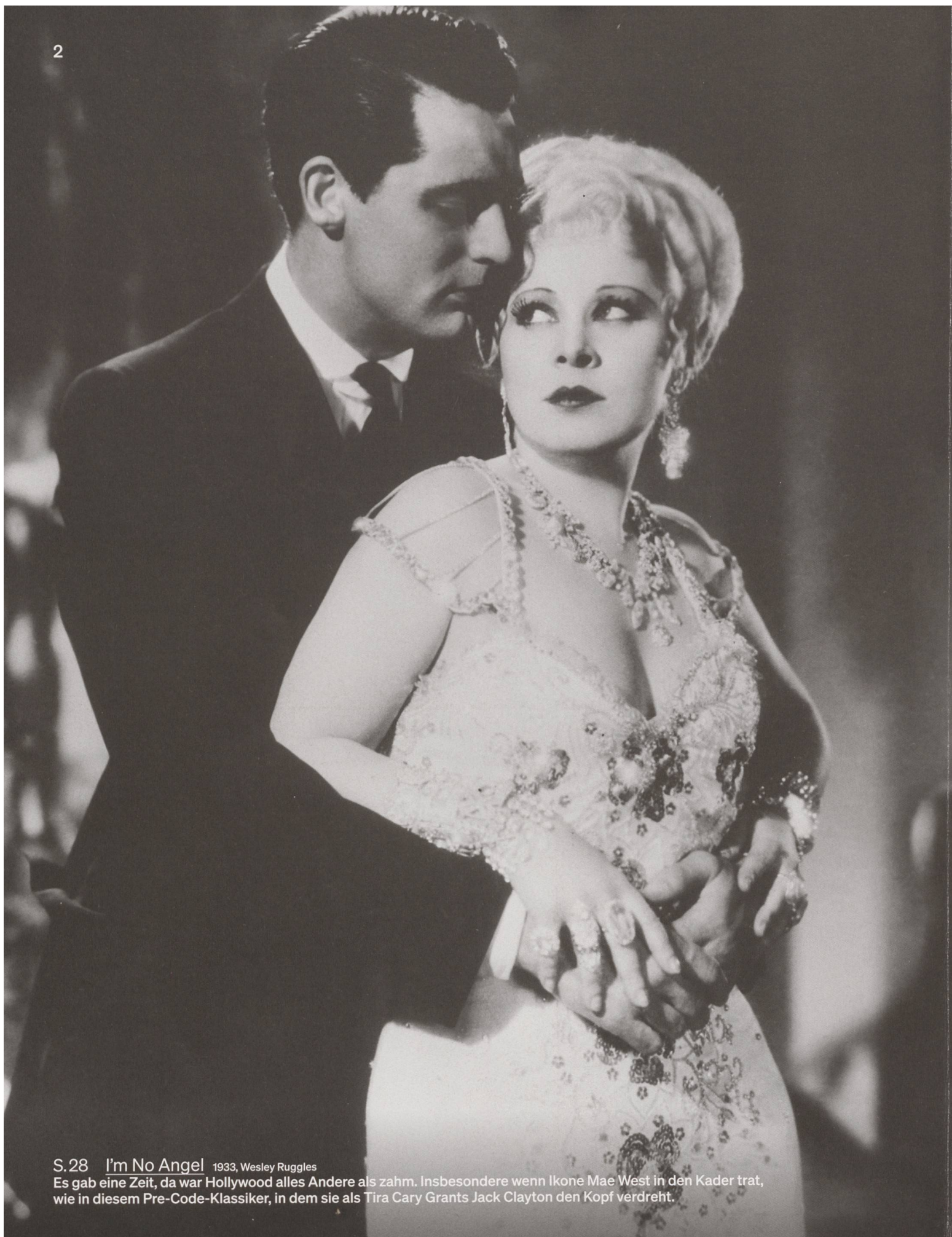
S.28 I'm No Angel 1933, Wesley Ruggles

Es gab eine Zeit, da war Hollywood alles Andere als zahm. Insbesondere wenn Ikone Mae West in den Kader trat, wie in diesem Pre-Code-Klassiker, in dem sie als Tira Cary Grants Jack Clayton den Kopf verdreht.