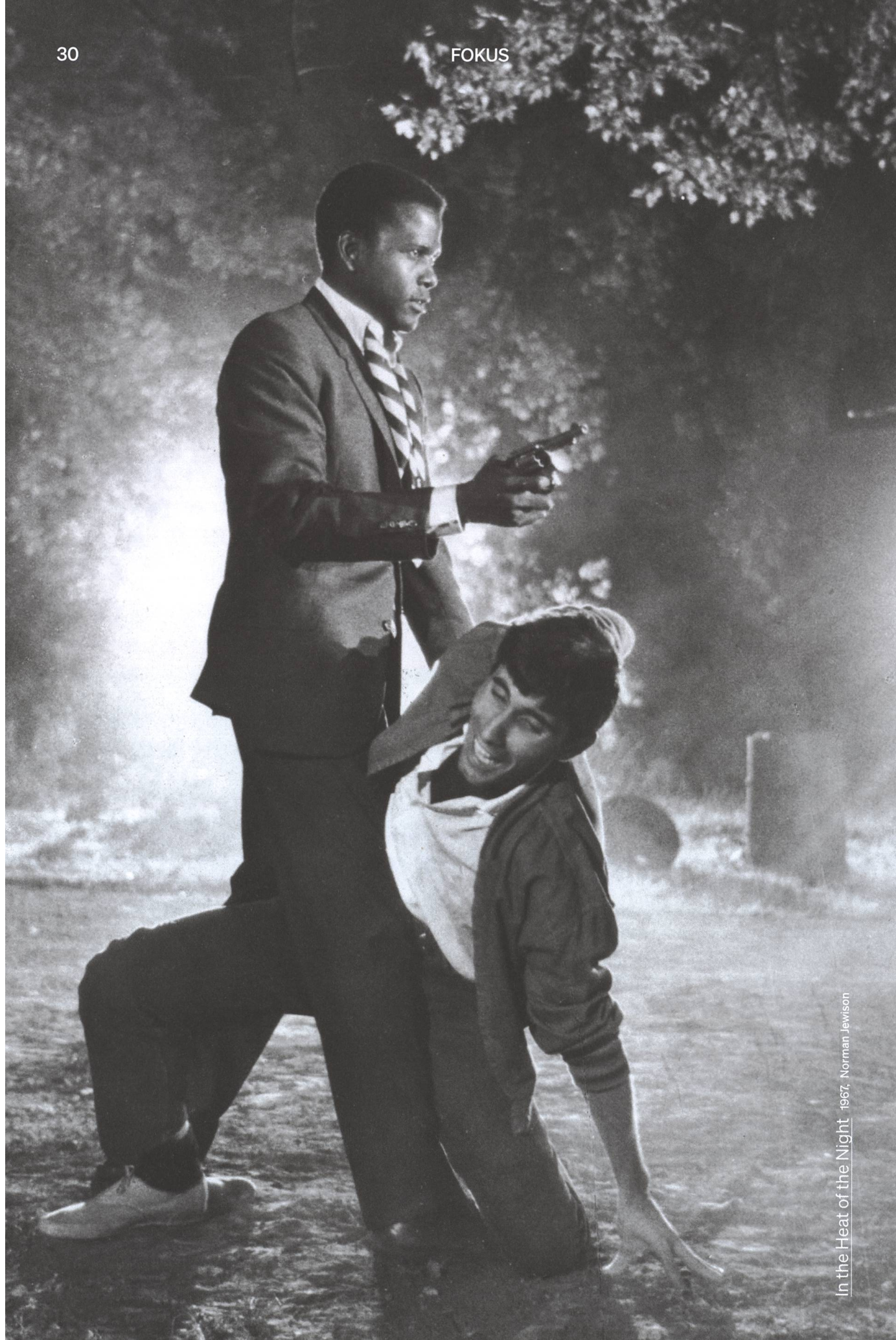
In the Heat of the Night 1967, Norman Jewison