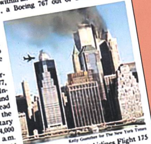
SECOND PLANE United Airlines Flight 175 nearing the trade center's south tower.