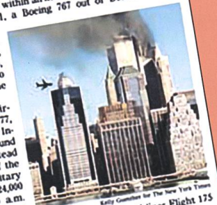
SECOND PLANE United Airlines Flight 175 nearing the trade center's south tower.