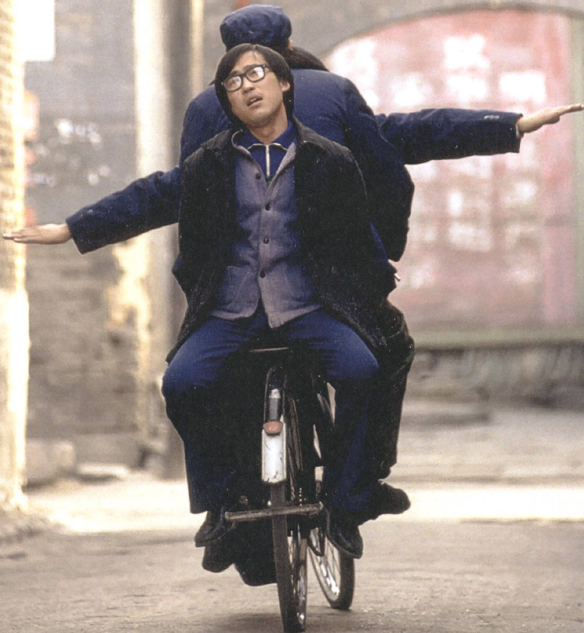
S.47 Platform 2000, Jia Zhangke

Normale «Nobodys» seien die Protagonist*innen in Jia Zhangkes Independentfilmen, schreibt Primo Mazzoni, mit ganz alltäglichen Sorgen. Sie kriegt man im chinesischen Mainstreamkino seltener zu Gesicht.