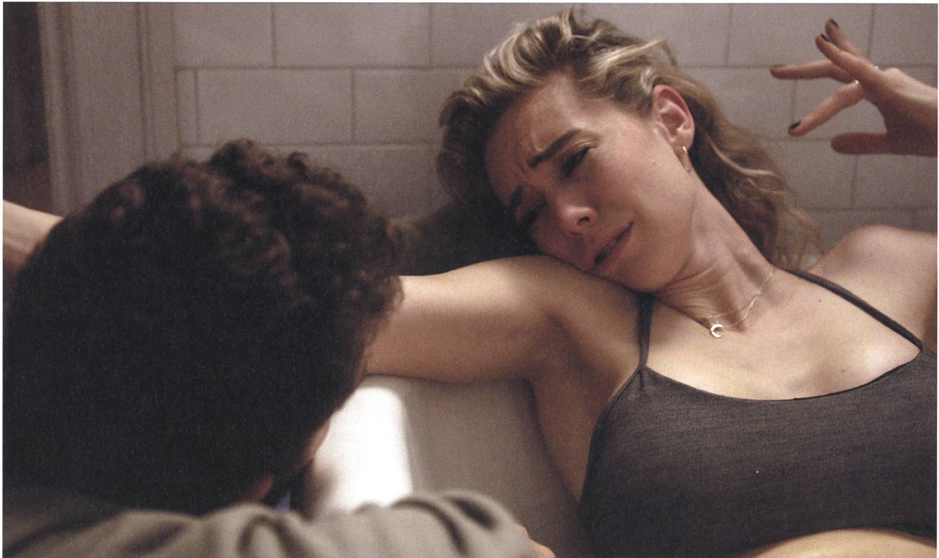
Pieces of a Woman 2020, Kornél Mundruczó